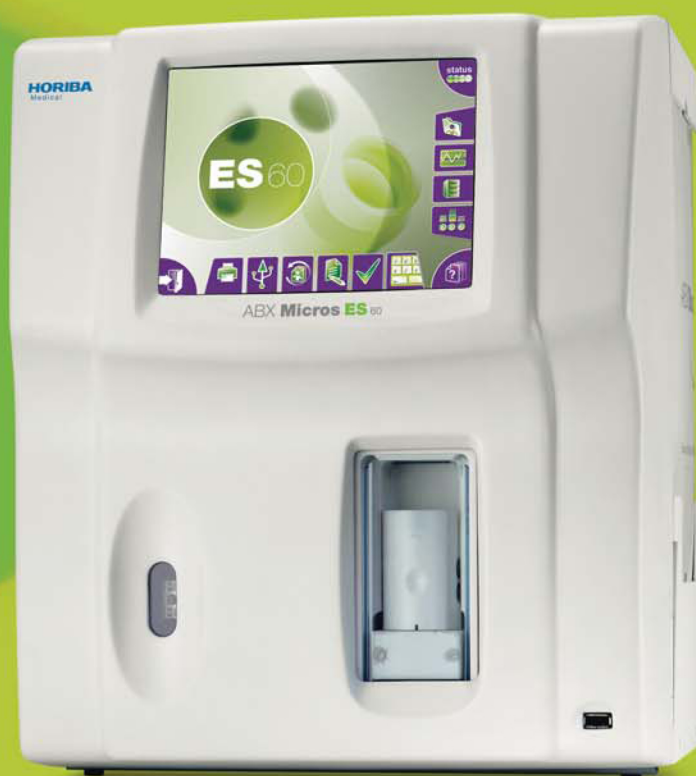
Versión tubo cerrado (Tubo abierto opcional)